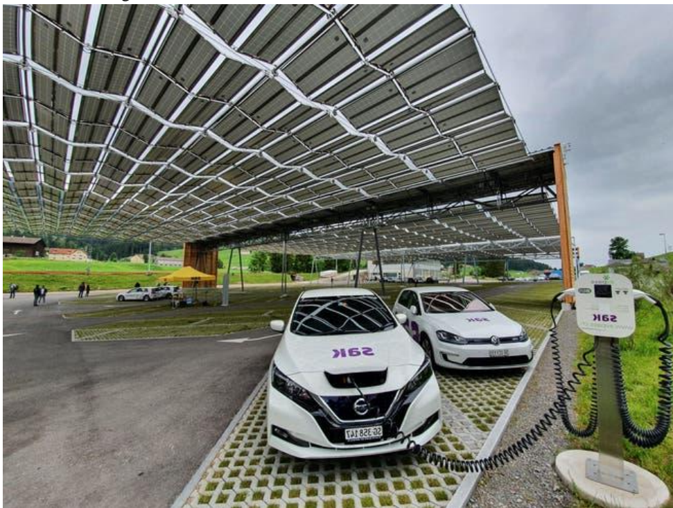
Das solare Parkplatz- Faltdach der St. Gallisch-Appenzellischen Kraftwerke (SAK) in Jakobsbad AI. (22. Juni 2020) SAK

Die Schweiz verpasst den Solarausbau. Ein Grund könnte der Fokus der Politik auf die Wasserkraft sein. Jürg Meier 15.05.2021, 21.45 Uhr